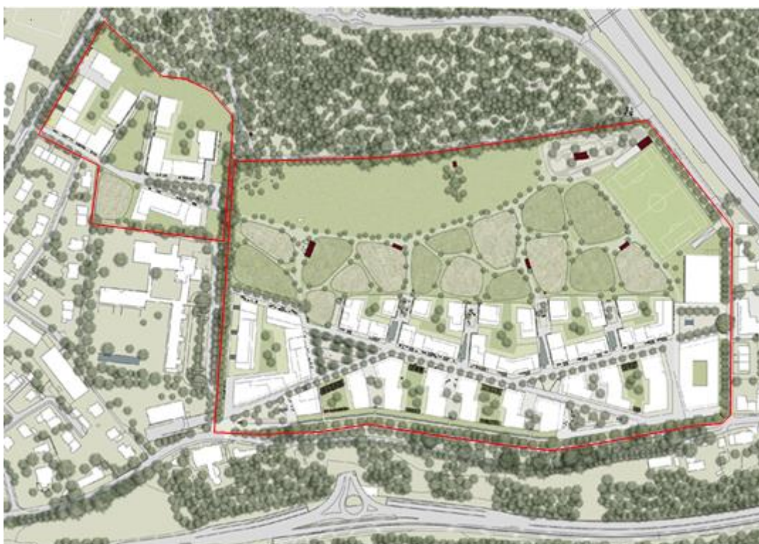
Städtebauliches Konzept Vierfeld / Mittelfeld gemäss Masterplan, Mai 2020, Planungssperimeter: rot

Die Masterplanung erfolgte gestützt auf die Ergebnisse des städtebaulichen Wettbewerbs und die Empfehlungen des Preisgerichts unter Federführung der Stadt und des Siegerteams «Städtebau» zusammen mit den beauftragten Teams der Projektteile «Wohnen». In einem ersten Schritt wurden die verschiedenen Lösungsvorschläge der Wohnideen auf das siegreiche städtebauliche Konzept abgestimmt. Im weiteren Verlauf wurden die verschiedenen Bauetappen definiert, die Nutzungen und Infrastrukturmassnahmen konkretisiert sowie die Baurechtsgrundstücke festgelegt. Der Prozess wurde von Vertreterinnen und Vertretern der Wettbewerbsjury begleitet.